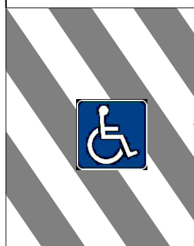
RAMPA ACCESO DISCAPACITADO